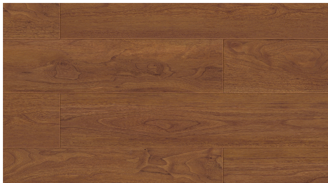
Vinylová podlaha Gerflor Creation 30 Morris 0256